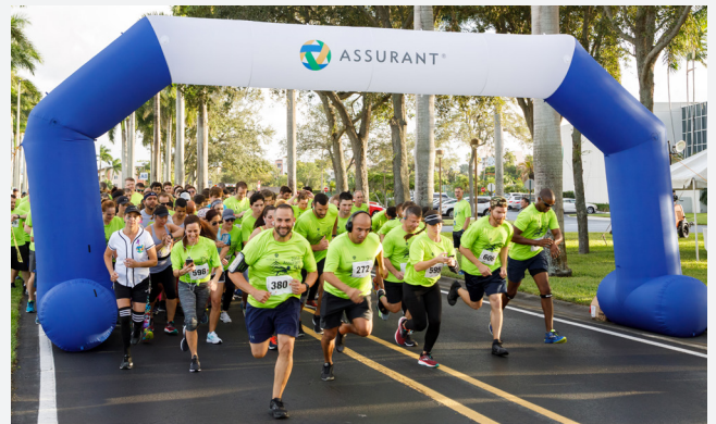
An Standorten auf der ganzen Welt engagieren sich Mitarbeiter freiwillig für die Gemeinden, in denen sie leben und arbeiten. Unser Assurant 5K zugunsten von United Way of Miami-Dade hat seit 2016 fast 450.000 USD gesammelt.

Gesunder Menschenverstand, gute Sitten, ungewöhnliches Denken und ungewöhnliche Ergebnisse leiten die Art und Weise, wie wir unsere Kunden unterstützen und miteinander umgehen.